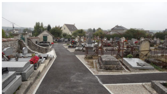
Le cimetière en octobre 2015 pour l'inauguration

Comme nous l'avons expliqué à certains, tout est une question de choix : l'entretien des bâtiments communaux, des investissements nouveaux, une taxe foncière modérée ou des